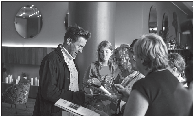
Rafał Królikowski wśród fanów - FG Międzyzdroje 2019

stów i doceniana przez mieszkańców Promenada Gwiazd, kiedy to znane osobistości polskiej sceny kulturalnej odcisnęły swoje dłonie w pamiątkowych płytach. Ciekawostka: przez pierwsze lata Festiwal miał charakter kameralny, ale z każdym rokiem zyskiwał na popularności. Ostatnie lata tłumy gości