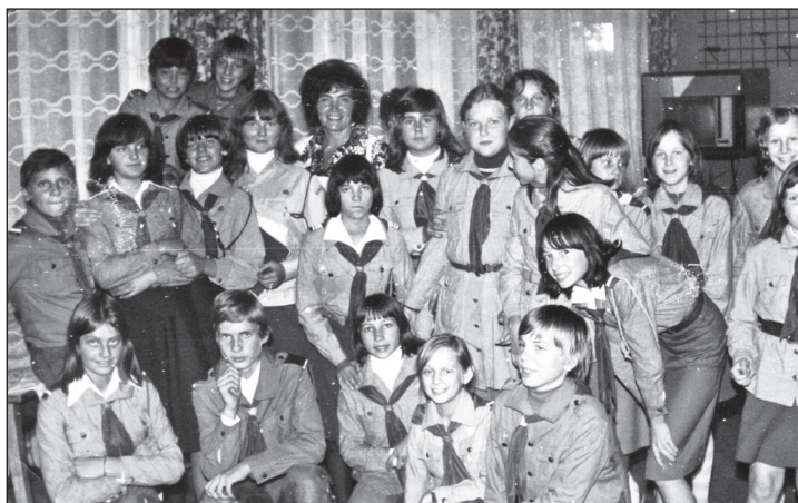
33 Drużyna Harcerki w Międzyzdrojach - 11 października 1978 r.

Czuj! Czujwaj! Zuchy i harcerze X Szczep „Gniazdo” ZHP