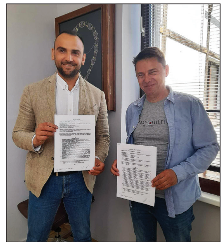
Podpisanie umowy na opracowanie dokumentacji projektowej w ramach modernizacji budynku Przedszkola Miejskiego nr oraz Szkoły Podstawowej nr 1 w Międzyzdrojach (UM)

Ponadto w dawnym budynku po Gimnazjum, przy ulicy Kolejowej, który przeznaczony został na Centrum Integracji Społecznej, prowadzone są kolejne prace. Po wyremontowaniu pomieszczeń dla Klubu Seniora, Środowiskowego Domu Samopomocy, organizacji emeryckich (przy dużym ich własnym