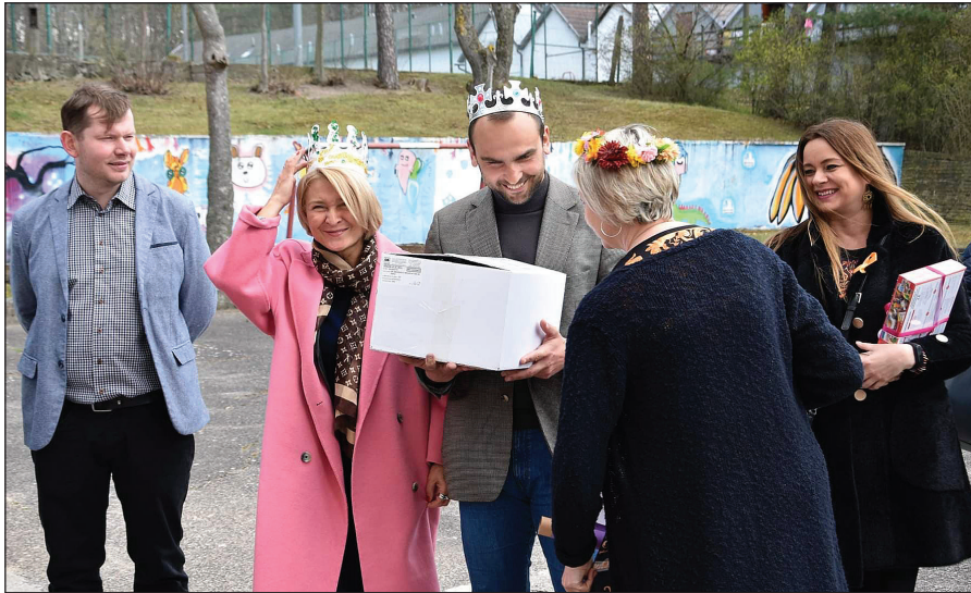
Otwarcie Świetlicy Środowiskowej Iskierka