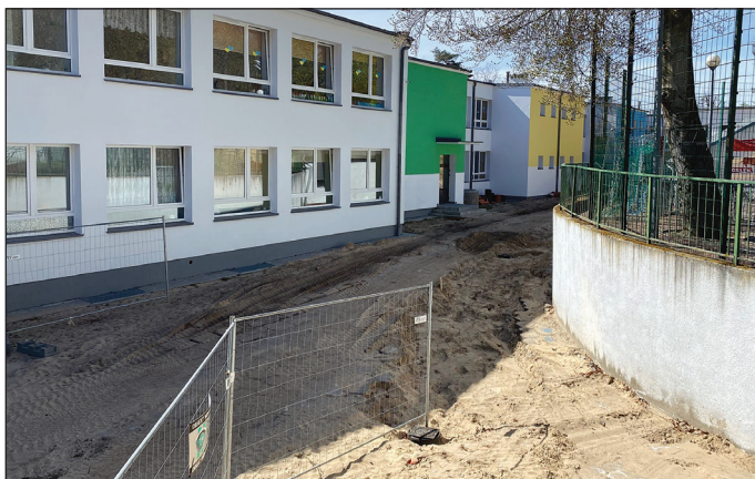
SP 1 w Międzyzdrojach - budowa bieżni (miedzyzdroje.tv)