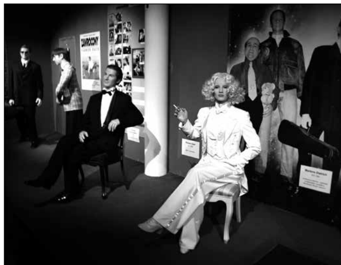
Gabinet Figur Woskowych

Gmina Międzyzdroje to idealne miejsce do uprawiania sportów, turystyki kwalifikowanej i aktywnego wypoczynku. Dla pasjonatów sportów wodnych oddano do użytku port jachtowy w Wapnicy usytuowany na wschodnim brzegu jeziora Wicko Wielkie w północnej zatoce Zalewu Szczecińskiego. Park Linowy Bluszcz położony w pobliżu dworca PKP zaprasza wszystkich lubiących