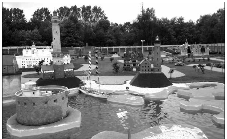
Bałtycki Park Miniatur

umiejscowiona jest w bunkrze, gdzie były składowane pociski V3. W pobliżu bunkra znajdują się