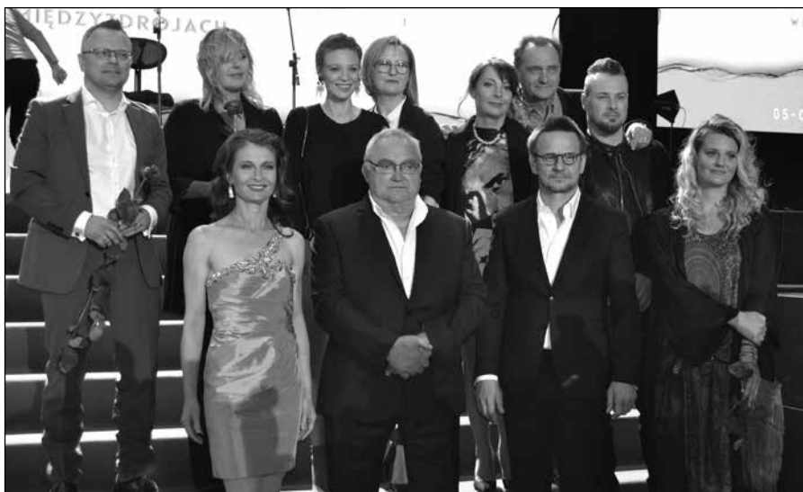
- To odciski, na które pracuje się całe życie – skomentował swój udział w Gali Odcisnięcia Dłoni Janusz Kondratiuk. Swoje trwałe ślad na Alei Gwiazd pozostawili również: Magdalena Boczarska, Edyta