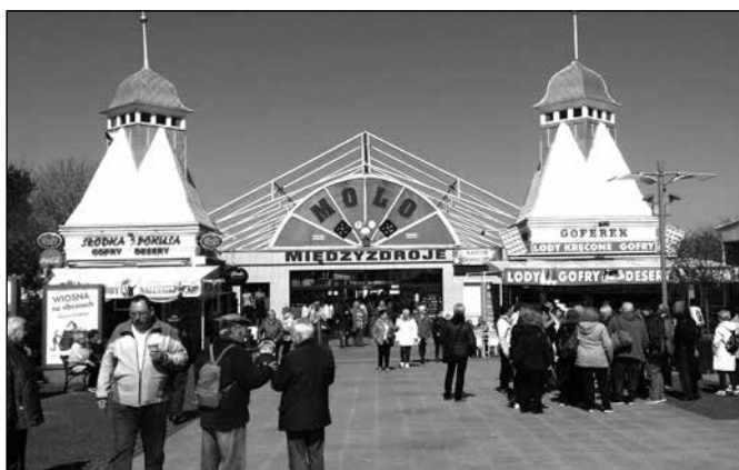
Plac przed molo

był król pruski Fryderyk Wilhelm IV, stąd dawna nazwa wzniesienia to Królewskie Wzgórze. Przy ulicy Krótkiej w centrum miasta znaj-