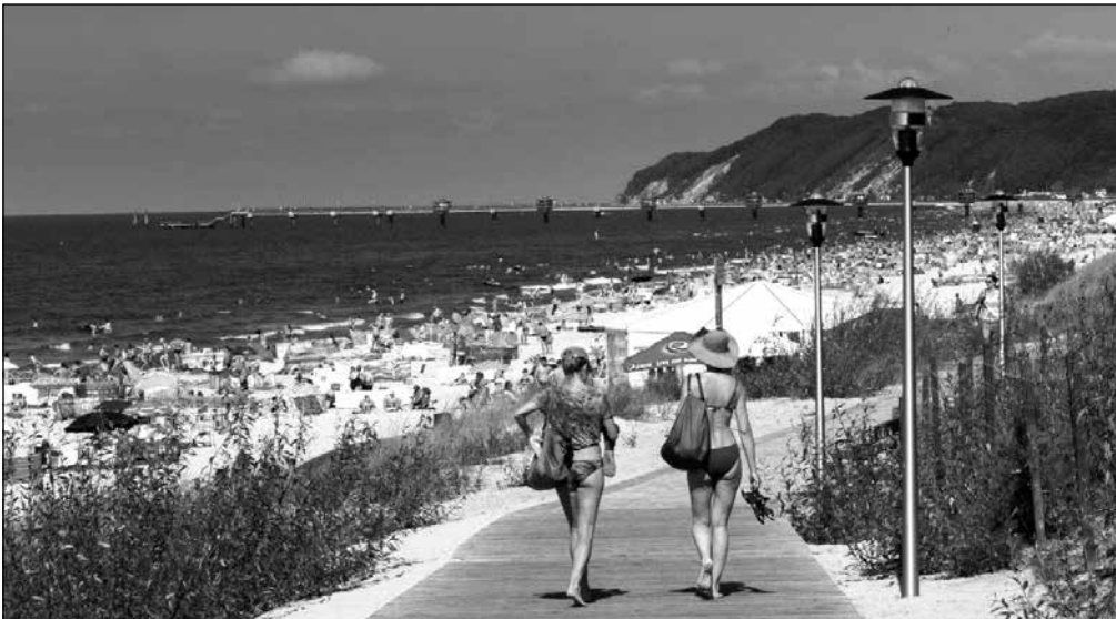
Kładka na wydmie

z urokliwych kwiatowych rabat i kwietnych figur – paw Tolek, motyl Emanuel, barwne kobierce w wielu częściach miasta przyciągają miłośników zieleni i spokoju. Na ich tle turyści robią pamiątkowe zdjęcia z wakacji lub upamiętniają ślubne uroczystości pod okiem profesjonalnych fotografów.