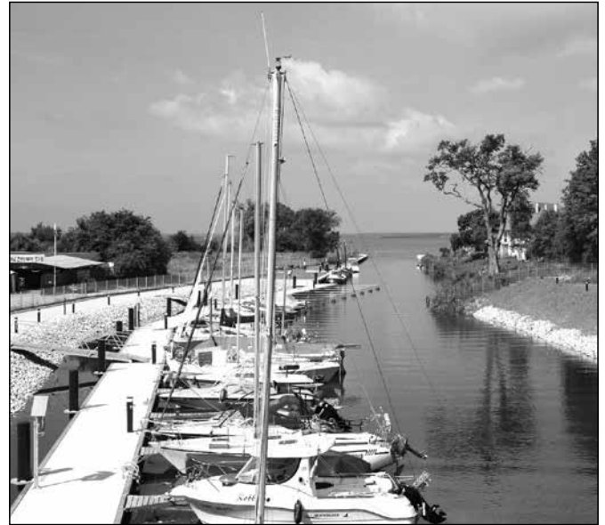
Port Jachtowy w Wapnicy

betonowe podstawy, pozostałości po działach dalekiego zasięgu. Od lat Międzyzdroje słyną