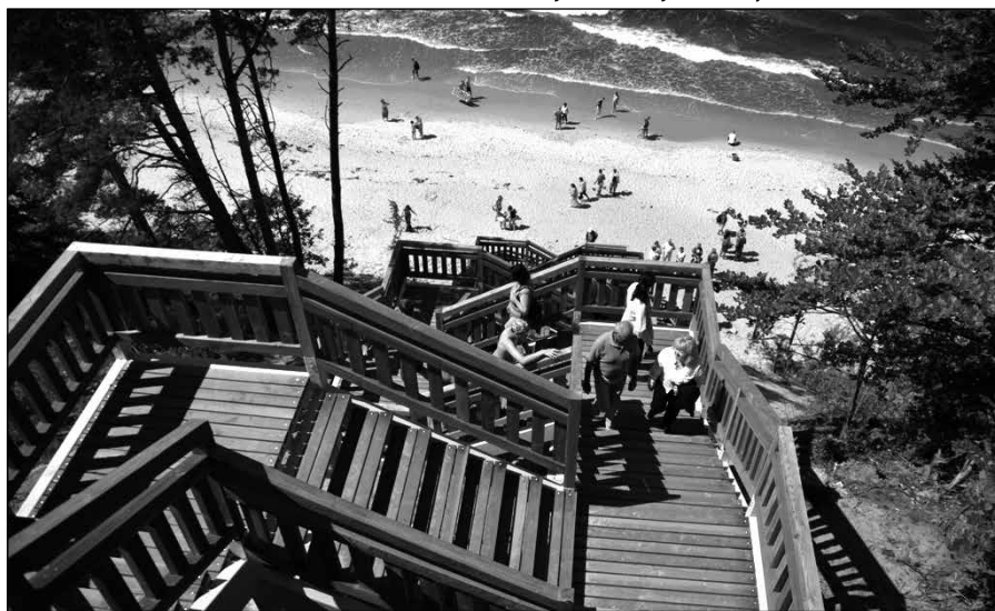
Schody na Kawczą Górę

Referat Promocji i Współpracy z Zagranicą