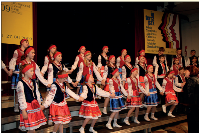
44. Międzynarodowy Festiwal Pieśni Chóralnej