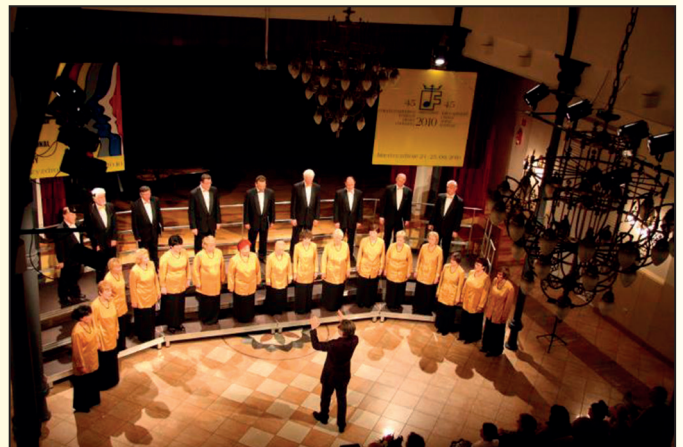
45. Międzynarodowy Festiwal Pieśni Chóralnej