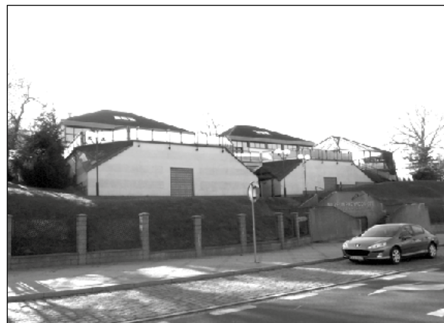
Muzeum Przyrodnicze obecnie