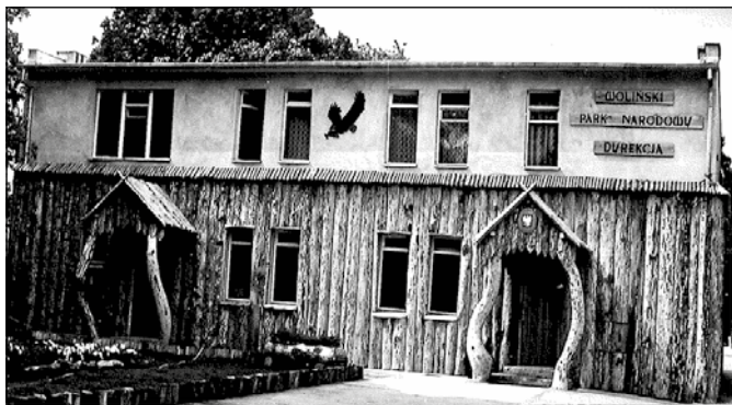
Dyrekcja Wolińskiego Parku Narodowego, druga połowa lat 70-tych XX wieku.

w Polsce muzealną kolekcją samców batalionów w szacie godowej, repliką największego bursztynu ważą-