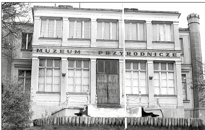
Dawne Muzeum Przyrodnicze WPN, druga połowa lat 70-tych XX wieku.