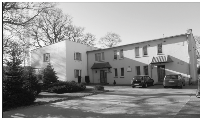
Obecna siedziba dyrekcji WPN

morskiej wód przybrzeżnych Bałtyku, archipelag wysp we Wstecznej Delcie Świny wraz z otaczającymi je wodami Zalewu Szczecińskiego. Jesteśmy pierwszym w Polsce parkiem morskim. Teraz Woliński Park Narodowy zajmuje 10937 ha.