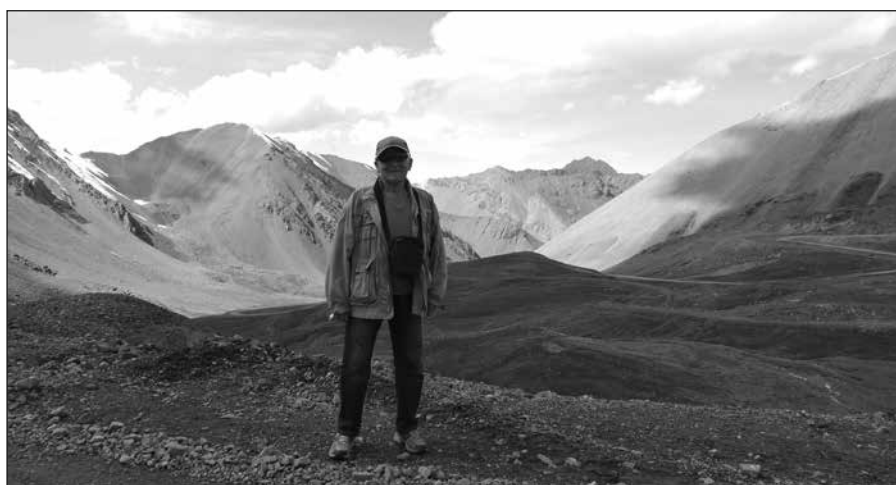
Na przełęczy Chanszanu (4000 m n.p.m.)

że są to ludzie biedni. Uwielbiają konie. Właściwie nie ma Kirgiza czy Kirgizki (nawet w miastach), którzy nie potrafiliby jeździć konno. Jest powiedzenie, że Kirgiz rodzi się na koniu i na koniu umiera. W przeważającej większości to muzułmanie, ale ubierają się po europejsku - z nielicznymi wyjątkami, zwłaszcza wśród kobiet. Kirgistan zamieszkuje sporo mniejszości narodowych: Rosjanie, Uzbegy, Tadźycy, Ujgurzy, Kazachowie. We wschodniej części oraz w dużych miastach jest dużo Rosjan, w zachodniej - Uzbeków. Jak się przekroczy granicę Azji, ma się wrażenie bycia w innym świecie. Co uderza, to uzębienie - wszyscy mają złote zęby, są tacy którzy mają obie złote szczęki. Oddzielną kwestią jest sprawa higieny, nie moglibyśmy się do tego przyzwyczaić.