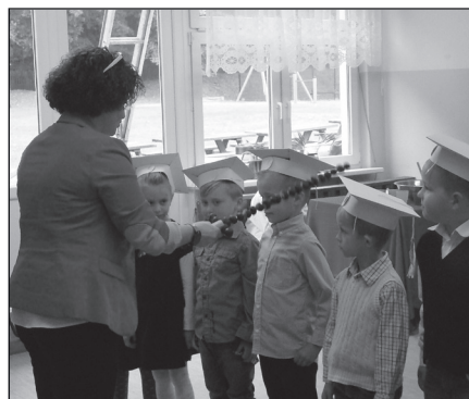
Uroczyste pasowanie na pierwszaków

Z okazji Dnia Edukacji Narodowej, zwanym potocznie „Dniem Nauczyciela”, uczniowie w szczególny sposób dziękują za codzienny trud i okazywane serce, za poświęcenie i zaangażowanie w pracę na rzecz nauczania i wychowania