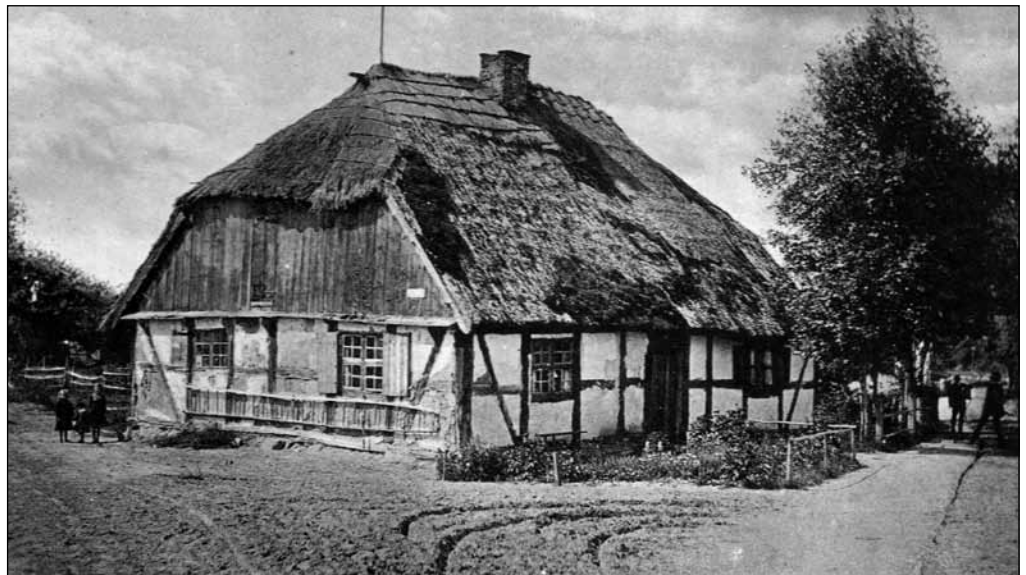
Najstarszy Dom - - (1890 - 1900)