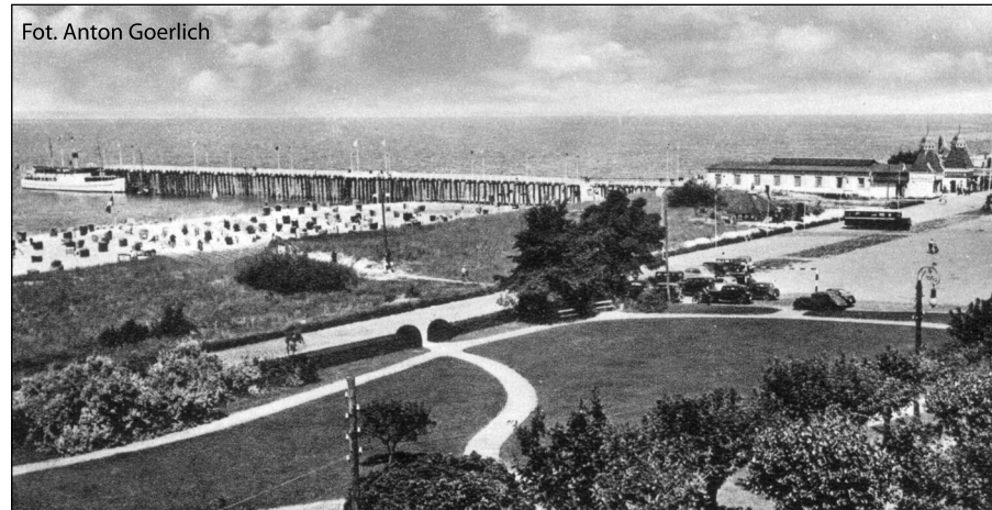
Fot. Anton Goerlich

Placówka WOP w roku 1945 była już obsadzona. Wojskowe kontrole na punktach: w Wiselce, na krzyżówce na dworcu PKP i po obu stronach