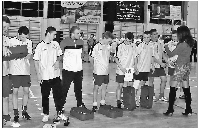
„Fala” – wręczenie nagród