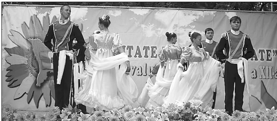
Polonez w wykonaniu zespołu Polacy Budzaka.