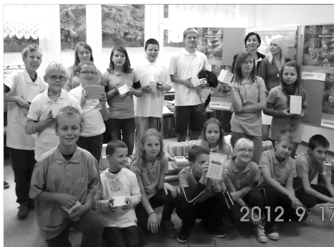
Na zdjęciu zwycięzcy konkursu pod hasłem „Czy warto segregować odpady?”