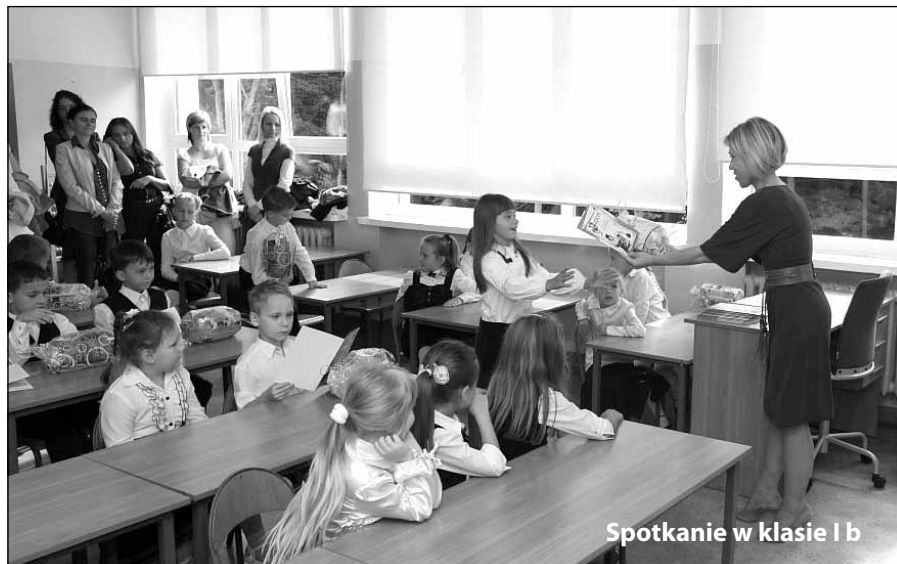
Spotkanie w klasie 1b