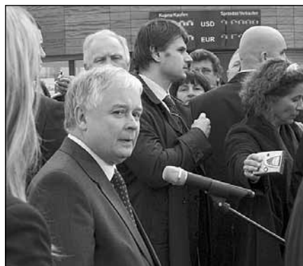
Podczas konferencji na międzyczdrojskim moście

gotowywać i osobiście uczestniczyć w wizytach najznakomitszych gości, którzy odwiedzili nasze miasto - Międzyzdroje: