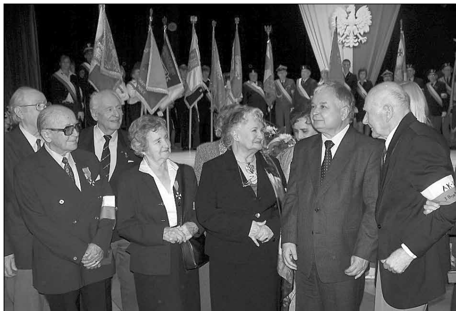
Prezydent RP Lech Kaczyński w otoczeniu kombatantów AK