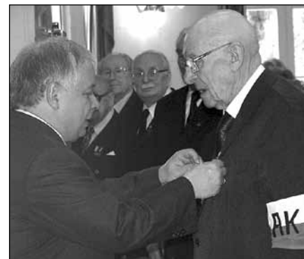
W trakcie zjazdu Prezydent RP wręczył ordery zasłużonym kombatantom, działaczom środowiska Światowego Związku Żołnierzy Kresowych AK

Około godziny 13.00 odbyły się uroczystości związane z otwarciem 26. Zjazdu Żołnierzy Kresowych AK w Międzynarodowym Domu Kultury z udziałem Prezydenta RP Pana Lecha Kaczyńskiego. W trakcie zjazdu Prezydent RP