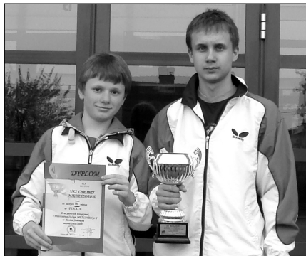
Na zdjęciu od lewej:

K. B. i R. B.: Zwiedziliśmy całą Polskę, wyjeżdżaliśmy też za granicę. Wszystkie wyjazdy są finansowane przez klub, sami nie moglibyśmy sobie na nie pozwolić. Mamy profesjonalny sprzęt, który jest bardzo drogi, np. nasze rakiety to koszt ok. 600 zł., do tego stroje i buty, czyli wydatki ponad 1000 zł. Naszych rodziców nie byłoby na to stać. Wyjeżdżamy na obozy sportowe, poznajemy ludzi, którzy wiele w życiu osiągnęli dzięki uprawianiu sportu, nawiązujemy nowe kontakty.