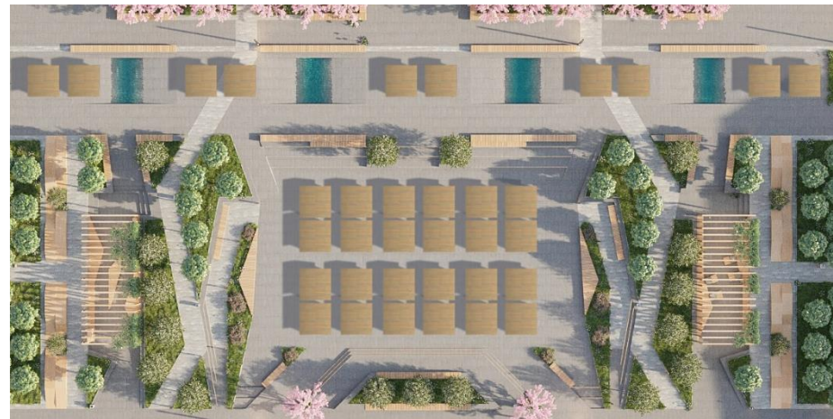
WARIANTY USYTUOWANIA PAWILONÓW HANDLOWYCH – OKOLICZNOŚCIOWE JARMARKI ŚWIĄTECZNE