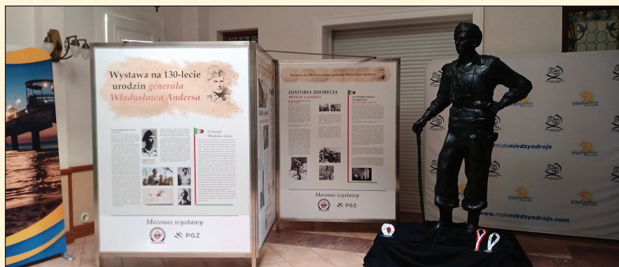
Wystawa odbywała się do 17 sierpnia 2022 r.

Prezentowana wystawa przybliżyła postać generała Władysława Andersa, ukazuje niezwykłą historię powstania pieśni pt. „Czerwone Maki”, a także przemarszu Armii Andersa, czy zdobycie klasztoru na Monte Cassino we Włoszech. W związku z obchodami 78. rocznicy Bitwy pod Monte Cassino ekspozycja była zaprezentowana również w mieście Cassino we Włoszech.