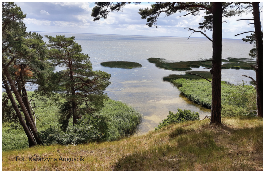
Fot. Katarzyna Augusciak