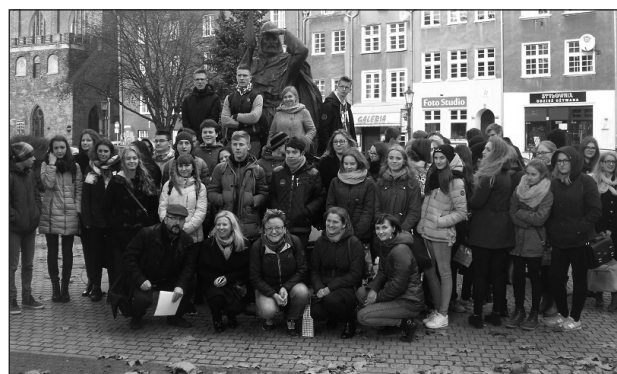
Międzynarodowa wymiana młodzieży - Gdańsk

imienia Tadeusza Rejtana. Nauka języka polskiego i wiedzy o Polsce trwa tu od 11 lat. Dzieci i młodzież rano chodzą do szkół białoruskich, a po południu i w weekendy przychodzą na zajęcia do Domu