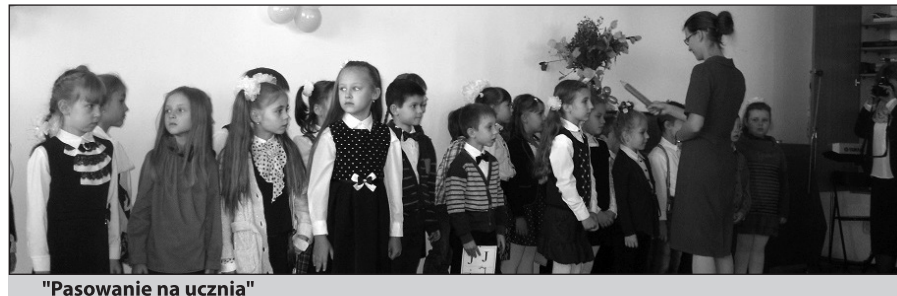
"Pasowanie na ucznia"

prowadzono linie kolejowe łączące Brześć z Moskwą i Równe z Wilnem, co przyczyniło się do jej rozwoju i zwiększenia liczby ludności. Do zaborów