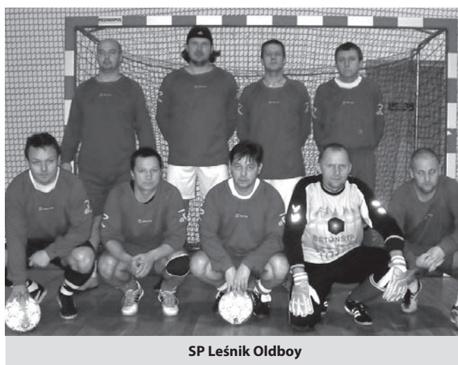
SP Leśnik Oldboy