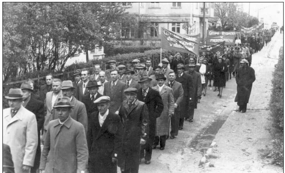
Międzyzdroje rok 1947