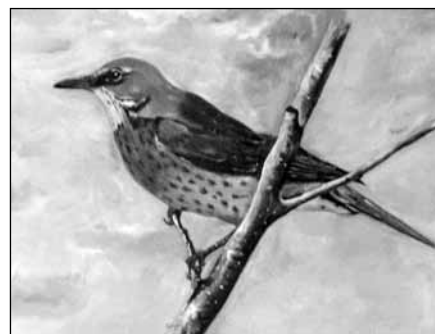
Jeden z obrazów z wystawy.