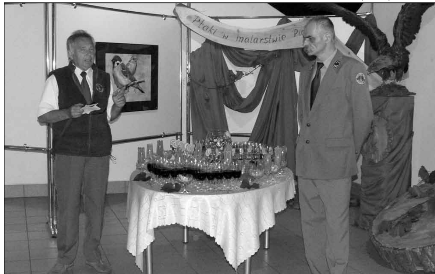
Dyrektor Wolińskiego Parku Narodowego oraz autor wystawy podczas uroczystego otwarcia.