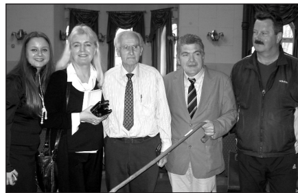
Organizatorzy i uczestnicy wystawy.